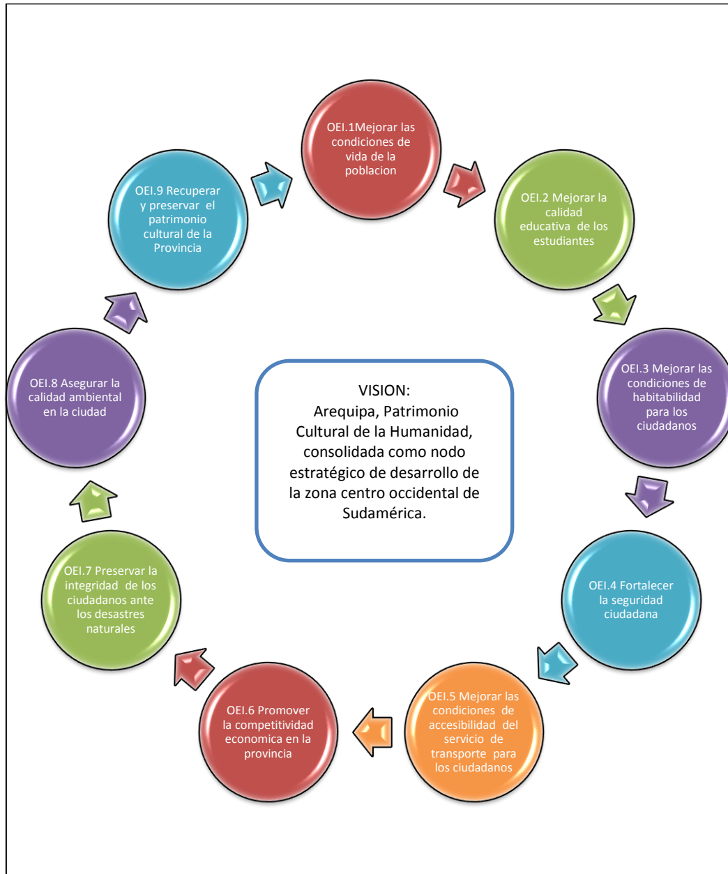
Figura N° 02 Patrón de Desarrollo de la Provincia de Arequipa

El análisis de la evaluación del Plan de Desarrollo Local Concertado PDLC de Arequipa al 2021, se realizó de acuerdo a los 09 Objetivos Estratégicos y Acciones Estratégicas; según el siguiente detalle: